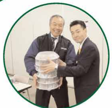
打ち上げは埼玉トヨペットさんで。ご協力ありがとうございます!