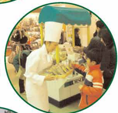
シェフもオリジナルケーキで盛り上げる!