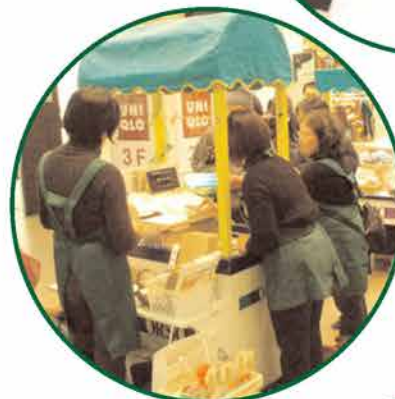
スタッフは3交代。レジの打ち方も引き継ぎ。