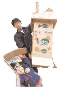
ダンボール ハウス

*そのほか、七輪、クラフト材料、楽器などいろいろなものは、スタッフ・参加者でもちよりました。