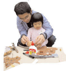
落ち葉で クラフト