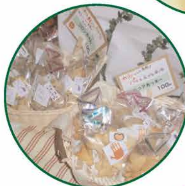
しびらきさんのクッキーは朝日新聞に載って大好評でした。